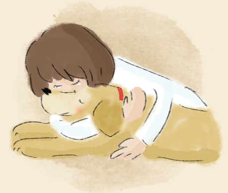
イラスト センサ チアキ